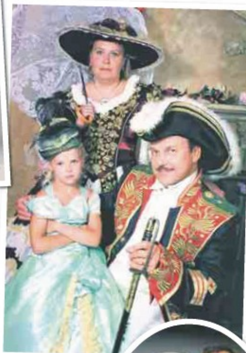
Bulgarian-matkalla Siltaloista nappattiin turistikuva lavasteissa keskellä katua. Roosa-tytär ei tykännyt yhtään!